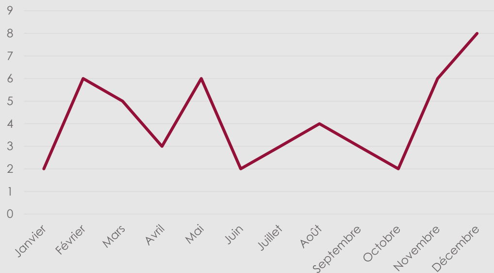
Nombres de Têlédossiers réalisés en 2017